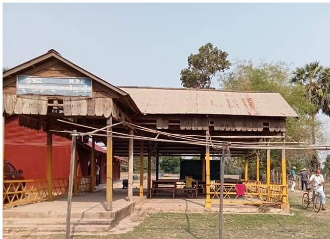
Taprom anno 2021

In 2022 start RAKO ook een nieuw onderwijsproject in Taprom . Het dorp ligt op ongeveer 45 km ten oosten van Siem Reap. Momenteel hebben ze hier 3 bouwvallige klaslokaaltjes. Hierdoor gaan er slechts 88 kinderen naar school met een leeftijd tussen 3 en 6 tot 8 jaar (kleuters, level 1 en level 2). Door het gebrek aan infrastructuur missen hier 100 tot 200 kinderen de kans op volwaardig basisonderwijs. De slechte staat van de klassen zorgt voor een onveilige situatie. Bovendien moeten leerlingen vanaf level 3 naar een andere school, aan de overkant van een drukke weg. Hierdoor maken veel kinderen deze letterlijke en figuurlijke overstap over de weg naar level 3 niet en verlaten ze de school op veel te jonge leeftijd. De inwoners dromen al lang van een veilige lesomgeving voor hun kinderen. Bovendien willen ze ook meer leerkrachten kunnen aantrekken zodat de kinderen hun volledige lagere schoolcarrière in het dorp kunnen afmaken. Deze kindonvriendelijke situatie wil RAKO de komende jaren verhelpen door op een duurzame manier voldoende klaslokalen te bouwen.