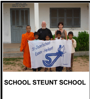
SCHOOL STEUNT SCHOOL