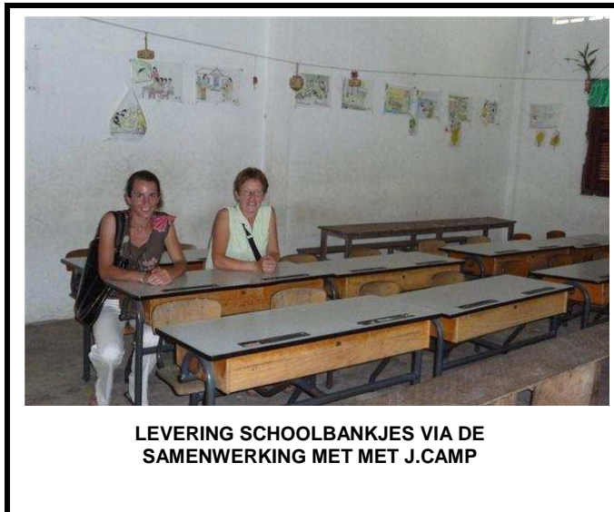
LEVERING SCHOOLBANKJES VIA DE SAMENWERKING MET MET J.CAMP