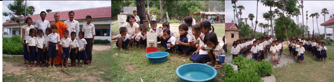
Hoe RAKO werkt en gewerkt heeft in 2008

Rako groeit en dit kan alleen door de inspanningen van een team van vrijwilligers. Mensen van het eerste uur die via een reis in contact kwamen met de gemeenschap en hun noden, of anderen die later aansloten omdat het project hun interesse kreeg.